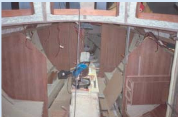
In Harlingen werden die Holzteile eingepasst

Auch auf den Einbau der Elektrik verwenden die Harlinger viel Sorgfalt. 24 Volt sind Standard; die zweipolige Verlegung der Kabel soll Elektrolyse ausschließen. Zwei ältere 36er , die ich näher in Augenschein nehmen konnte, waren denn auch korrosionsfrei. Nach dem vollständigen Ausbau wird das Schiff lackiert, geriggt und nach einem gründlichen Probeauf dem neuen Eigner übergeben.