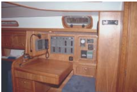
Funktionell: die Kartenecke

Steuerrad mit zwei Fingern führen. Feinfühlig segelt er so den Winddrehungen hinterher. Lässt er das Rad los, segelt das Schiff zunächst weiter seinen Kurs, fällt dann aber leicht ab. Frischt es etwas auf, läuft das Boot absolut ausgeglichen, und