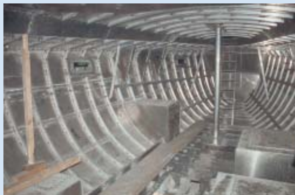
Aufwändig: Rundspanter auf Längs- und Querspanten