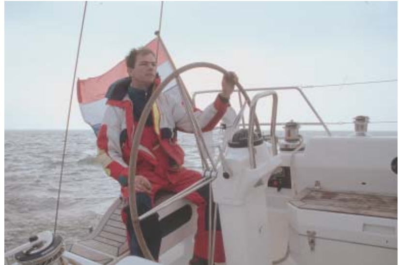
Das Schiff lässt sich sehr feinfühlig steuern und liegt ausgezeichnet auf dem Ruder; die Sitzposition des Rudergängers ist verbesserungswürdig